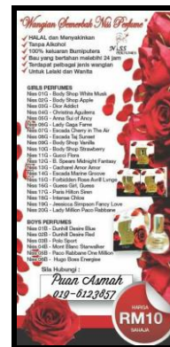
Caption : Contoh gambar yang telah di edit untuk promosi di Laman Media Sosial Facebook