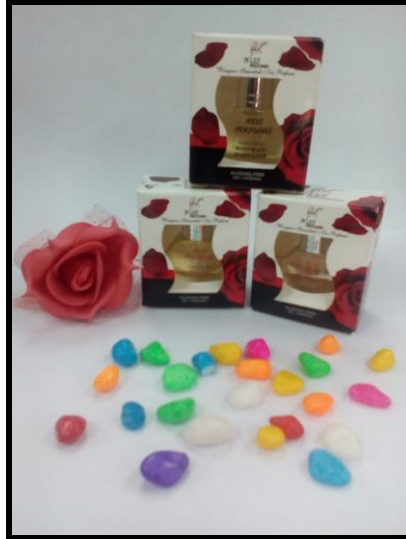
Caption : Niss Perfume